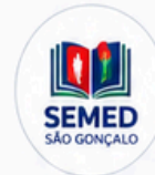
Secretaria Municipal de Educação de São Gonçalo (RJ)