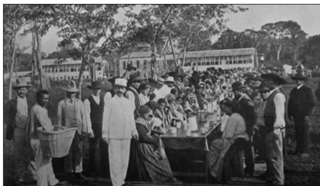
Subsidiadas pelo governo, cerca de cem famílias de agricultores italianos chegaram ao Pará em 1898. Imagem da hospedaria dos imigrantes italianos na colônia Outeiro.

Um dos fatores econômicos que mais teria contribuído para essa atração de imigrantes italianos para a região Norte do Brasil foi: