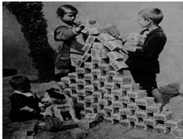
Crianças alemãs brincando com dinheiro após a Primeira Guerra Mundial.

35. A imagem demonstra o estado crítico em que se encontrava a economia alemã logo após a Primeira Guerra Mundial. Sem sombra de dúvidas, a Alemanha foi a nação europeia que mais sofreu os efeitos do conflito mundial. E, durante a República de Weimar (1919 – 1933), mesmo com uma série de mudanças e com a ajuda financeira dos EUA, a economia alemã não apresentava sinais de recuperação.