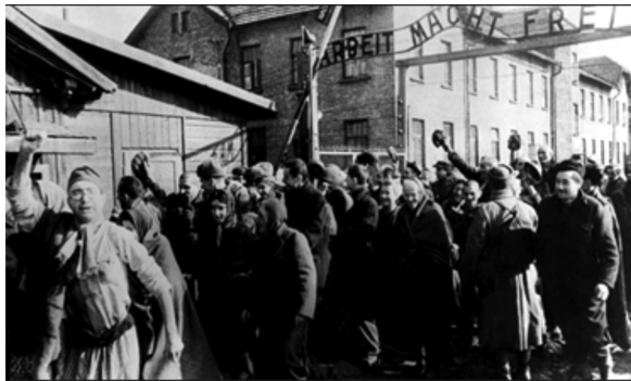
Os últimos prisioneiros de guerra deixando Auschwitz.

36. Observe a imagem e leia o texto a seguir: