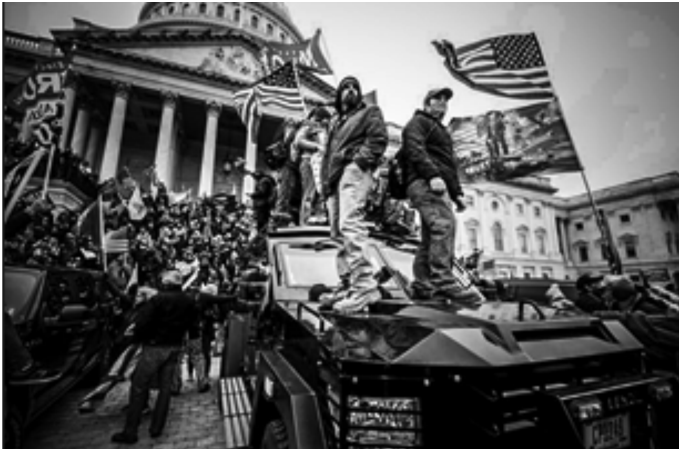
Na invasão ao Capitólio, nos EUA, manifestantes tentavam impedir a ratificação da vitória eleitoral de Biden, 06/01/2021.

CASTELLS, Manuel. Ruptura: A crise da democracia liberal . Rio de Janeiro: Zahar, 2018.