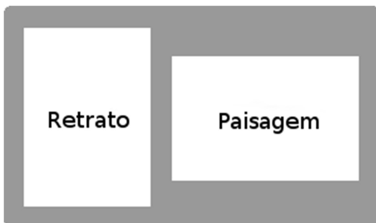
Forma correta de digitalização dos documentos

11.5.1. O candidato deverá digitalizar os documentos no formato RETRATO (vertical) ou PAISAGEM (horizontal), com as informações disponíveis para os avaliadores sem necessidade do uso do recurso de "girar visualização", conforme imagens a seguir.