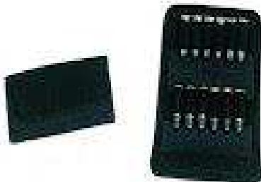
Porta carregador Duplo para pistola (Universal) - COM TAMPA ou SEM TAMPA