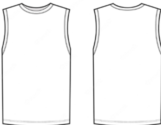
Modelo Camiseta Regata Branca Feminina