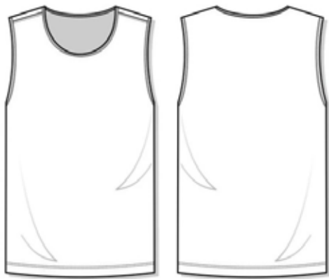
Modelo Camiseta Regata Branca Masculina