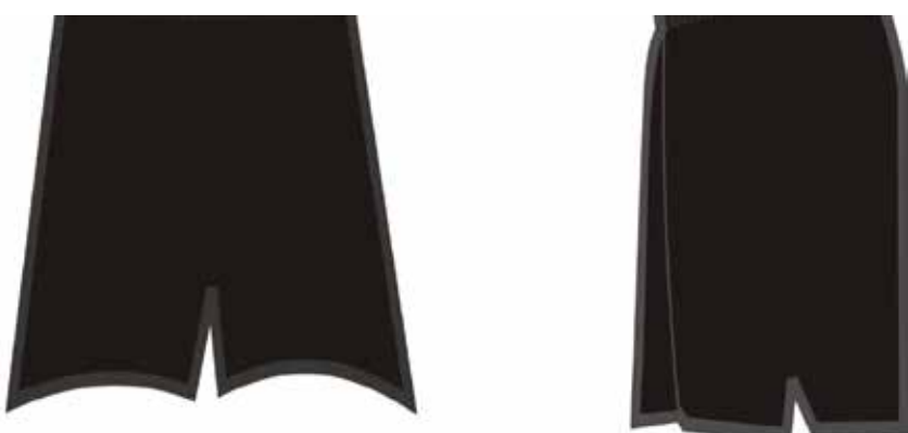
Modelo shorts Azul Marinho Masculino