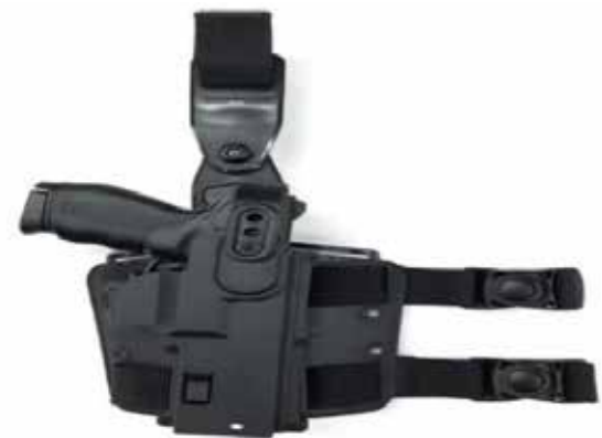
Coldre de Perna Universal Destro ou Canhoto