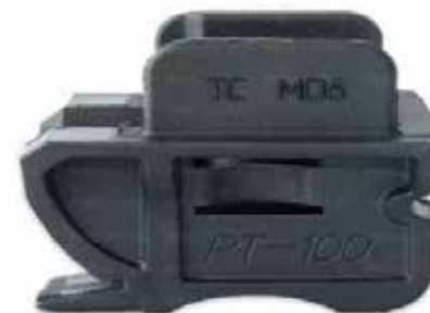
Adaptador para Coldre da Pistola PT100 .40