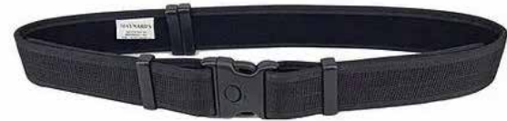
Modelo Cinto Preto