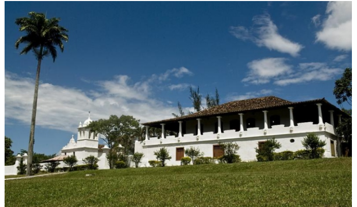
Fazenda Colubandê e Capela de San'Ana. ( https://pt.wikipedia.org/wiki/Fazenda_Coluband%C3%AA )

https://www.facebook.com/riobonito.antigo/posts/944667262221512/