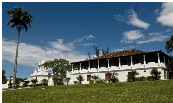
Fazenda Colubandê e Capela de San'Ana.

https://www.facebook.com/riobonito.antigo/posts/944667262221512/